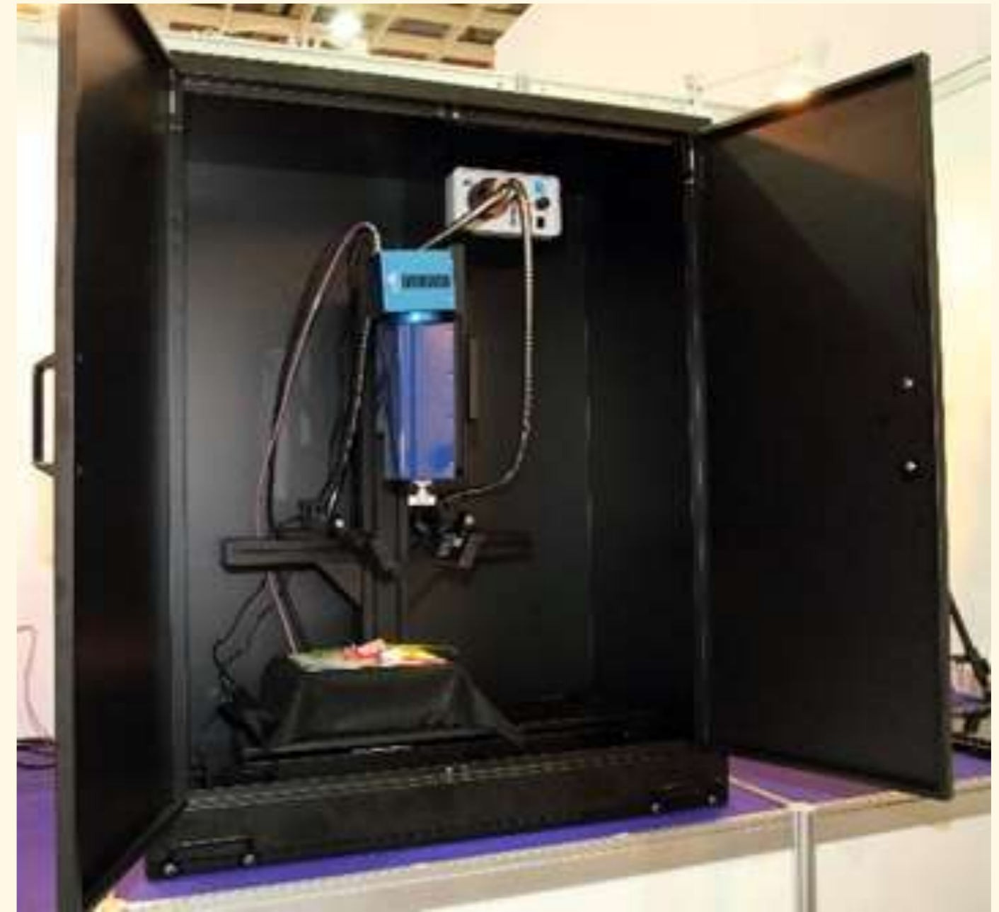
標準暗箱拍攝架構 (請參考配件:暗箱系統)